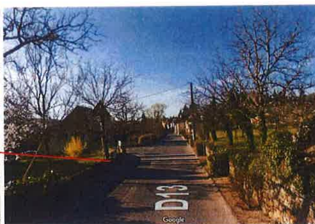
Sens 1 de Gindou vers Cazals