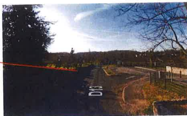
Sens 1 de Cazals vers Marminiac